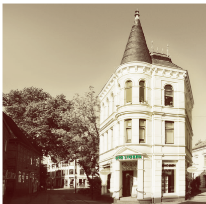
BÜRO NEUMÜNSTER Mühlenbrücke 8

Im Herzen Schleswig-Holsteins liegt, verkehrsgünstig und zentral, unser Regionalbüro Neumünster an der Mühlenbrücke 8.